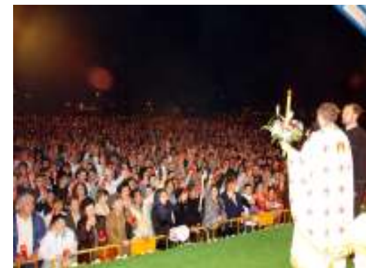
Imagen de la Misa del Pascua 2008