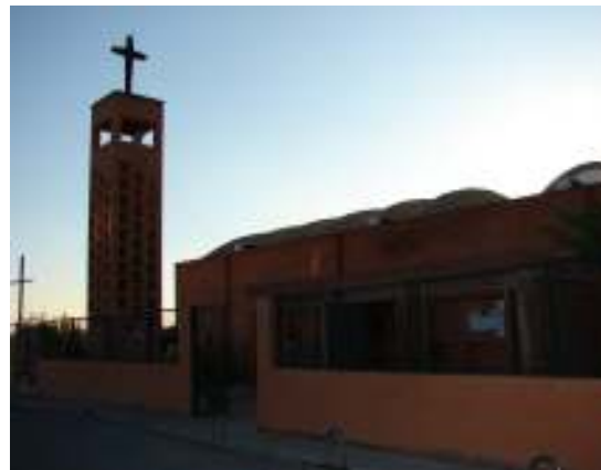
La Iglesia Romano-Católica "Santa Cruz" de Coslada, en el cuyo recinto se encuentra la capilla ortodoxa rumana "San Nectario Taumaturgo"