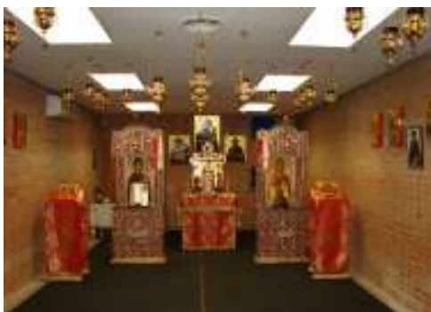
Imagen de la capilla

Las misas se celebran en el sótano ubicado en el recinto de la iglesia romano-católica "Santa Cruz" de Coslada, situada en la calle Chile, cerca de la estación de RENFE.