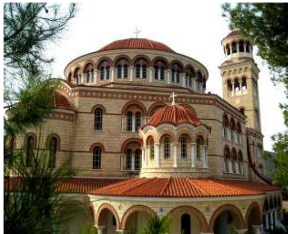
Monasterio "Santa Trinidad" de Eghina (Grecia)