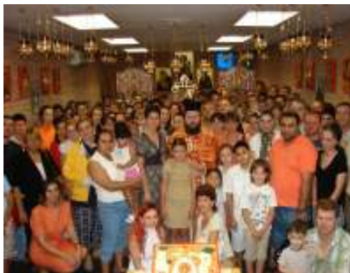
Imagen de la capilla, con los feligreses, después de la Santa Liturgia

En la parroquia, los sábados, está funcionando, también una escuela Catequética para niños con horario de 18:00 a 19:00 horas y participan niños entre 4 y 16 años.