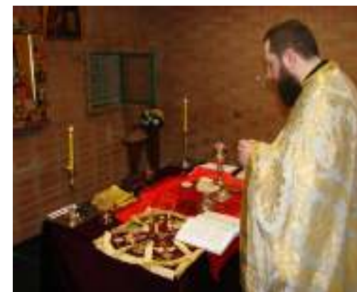
Imagen de la Misa del Gallo

Además de los conocimientos generales sobre la religión cristiana ortodoxa, se dan clases de lengua y literatura rumana e historia y geografía de Rumania.